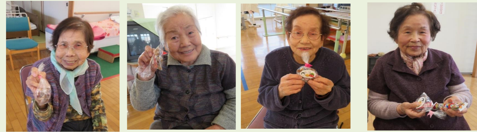
お土産をもらって「ハイチーズ！」