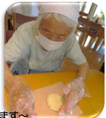
～生地をこねてなめらかにします～