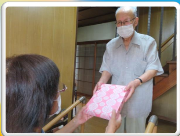
敬老会(記念品配布)